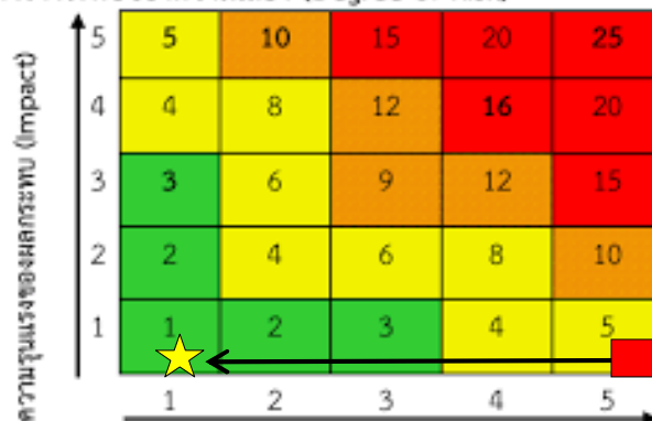
ตารางระดับของความเสี่ยง (Degree of Risk)