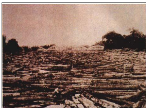
ซุงไม้สักมาตัดและทับถมที่สะพานรัชฎาภิเษก จ.ลำปางในปี พ.ศ. ๒๔๖๔

ในช่วงระหว่างสงครามโลกครั้งที่ ๒ ใน พ.ศ. ๒๔๘๔ รัฐบาลไทยได้เพิกถอนสัมปทานการทำไม้สักจากบริษัทอังกฤษทั้ง ๔ บริษัท ด้วยเหตุผลทางการเมือง และเพื่อพยุงฐานะทางการเงินของรัฐบาล รัฐบาลได้จัดตั้งบริษัทไม้ไทยจำกัดขึ้น รับช่วงการทำไม้แทน หลังสงครามโลกใน พ.ศ. ๒๔๘๙ รัฐบาลจำเป็นต้องคืนสัมปทานป่าสักให้แก่บริษัททำไม้ต่างๆ ที่ยึดคืนมา และได้จัดตั้งองค์การอุตสาหกรรมป่าไม้ (อ.อ.ป.) ขึ้น แทนบริษัทไม้ไทย จำกัดใน พ.ศ. ๒๔๙๐ เพื่อดำเนินกิจการด้านป่าไม้ให้แก่รัฐบาล จนกระทั่ง พ.ศ. ๒๔๙๗-๒๔๙๘ สัมปทานป่าสักของบริษัทต่างๆ ได้สิ้นสุดลง และไม่ได้รับต่อสัญญา รัฐบาลได้จัดตั้งบริษัทป่าไม้ร่วมทุนขึ้น โดยรวมทุนจากบริษัททำไม้ทั้งหมดสัมปทานทั้ง ๕ บริษัทเข้าด้วยกัน โดยรัฐบาลไทยถือหุ้นร้อยละ ๒๐ นอกจากนี้ยังได้จัดตั้งบริษัทป่าไม้จังหวัดขึ้น เพื่อรับทำไม้ในท้องที่จังหวัดนั้นๆ ป่าสักได้ถูกแบ่งออกเป็น ๓ ส่วนคือ ให้องค์การอุตสาหกรรมป่าไม้ทำหนึ่งส่วน บริษัทป่าไม้ร่วมทุนหนึ่งส่วน และบริษัทป่าไม้จังหวัดอีกหนึ่งส่วน จนกระทั่ง พ.ศ. ๒๕๐๓ เมื่อหมดสัมปทาน รัฐบาลจึงได้มอบให้องค์การอุตสาหกรรมป่าไม้ เป็นผู้ดำเนินกิจการทำไม้สักทั้งหมด ยกเว้นสัมปทานป่าสักของเอกชนที่อายุสัญญายังเหลืออยู่ บริษัททำไม้ต่างชาติ ทั้ง ๕ บริษัทก็ได้ปิดกิจการลง