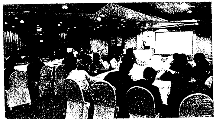
นำเสนอโครงการปรับปรุงสิ่งอำนวยความสะดวกสำหรับคนพิการ พื้นที่ ประตูท่าแพ