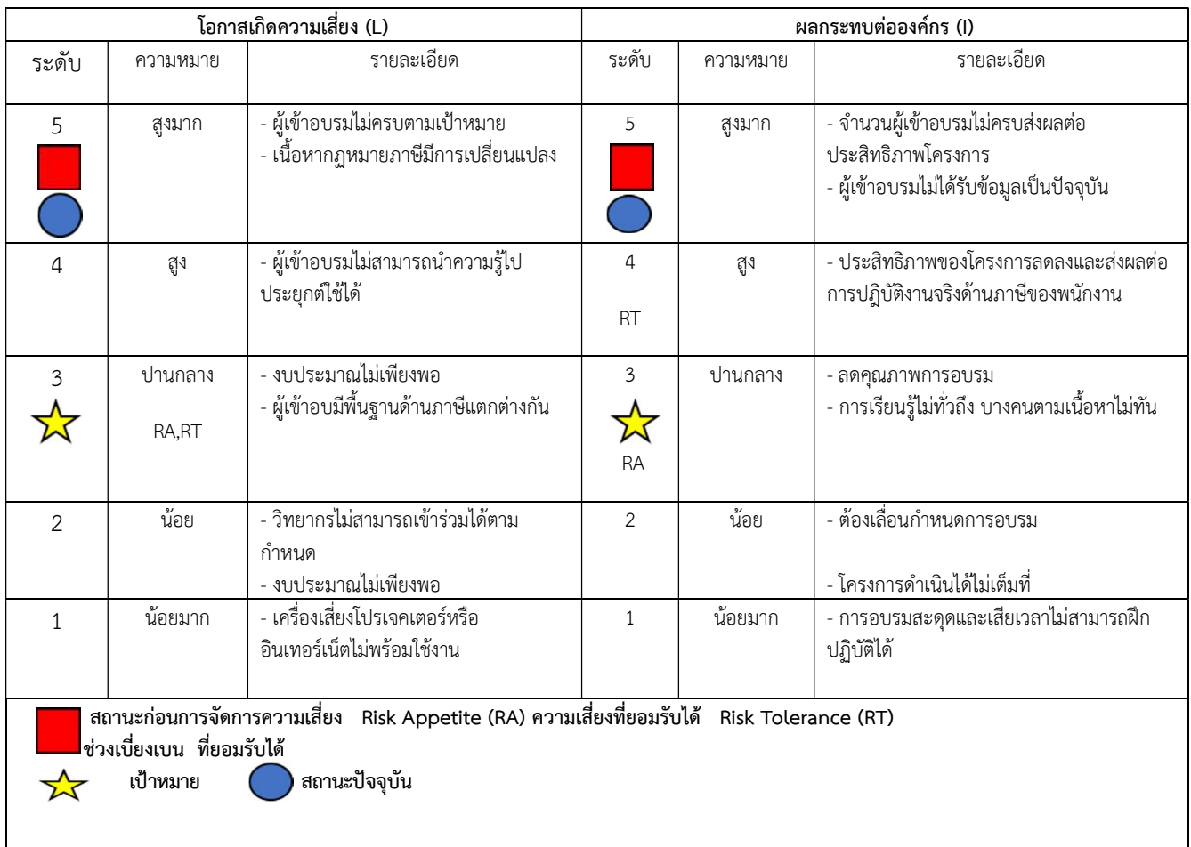
ตารางระดับความเสี่ยง (Degree of Risk)